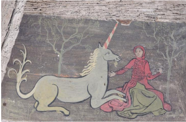
La dame à la licorne