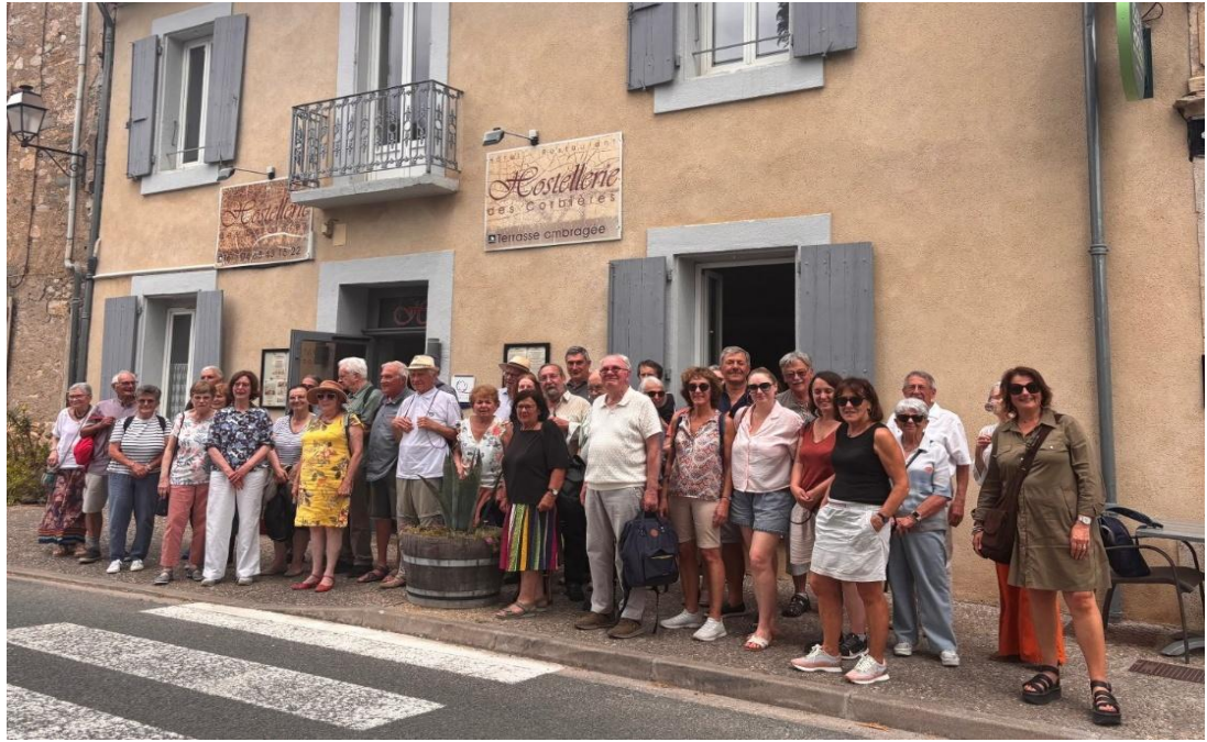
Photo de groupe devant l'Hostellerie des Corbières